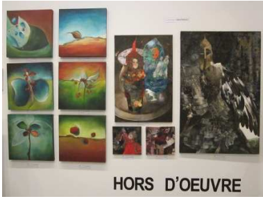
ESPACE 1 4 déc – 29 déc